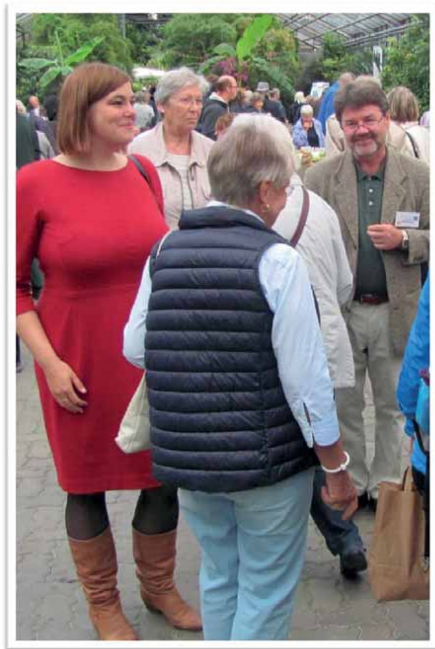
Überraschungsgast: Hamburgs Zweite Bürgermeisterin Katharina Fegebank auf den Norddeutschen Apfeltagen