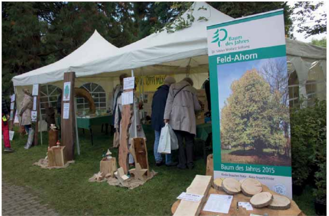
Stand der Baumpflege Thomsen