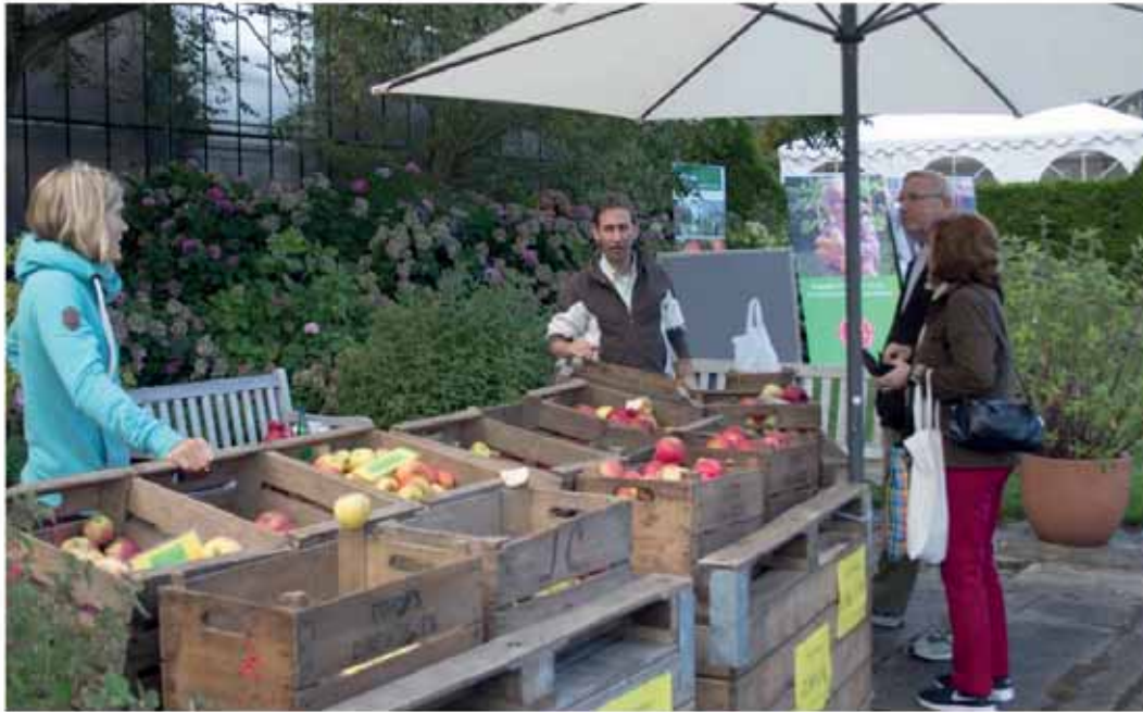
Der Stand der ÖON Das Apfelschiff (unten)