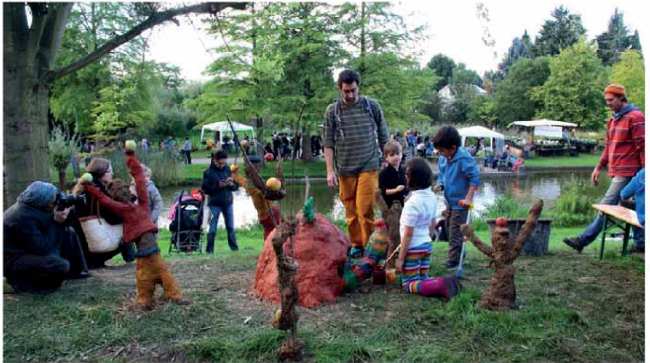
Gestalten mit Lehm Malen und Entdecken (unten)