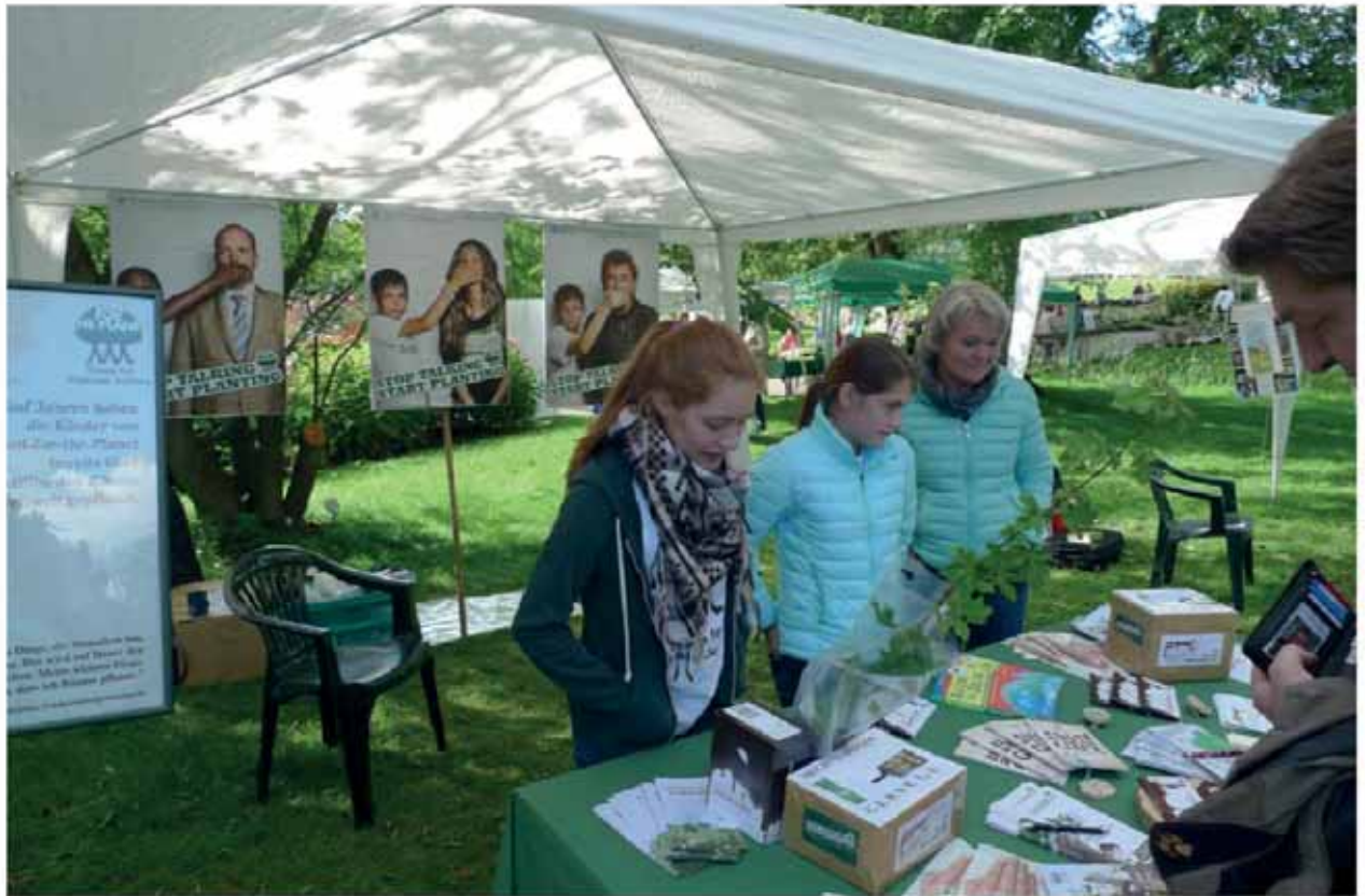
Plant for the Planet Stand des Botanischer Sondergarten Wandsbek (unten)