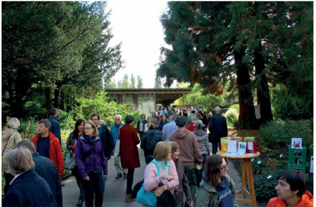
Eingangsbereich des Loki-Schmidt-Gartens Hinweisschilder für die Besucherlenkung (unten)