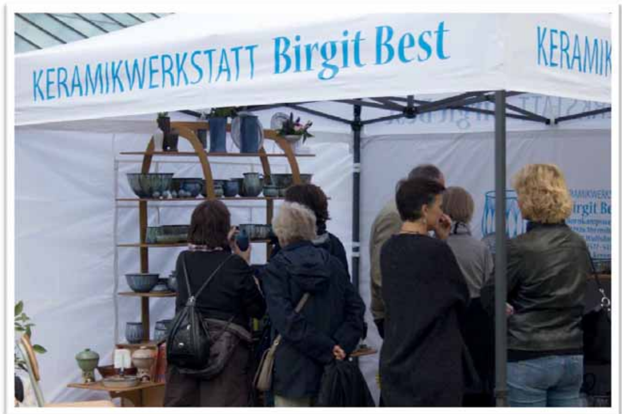
Keramik von Birgit Best Demeter Kräuter (unten)