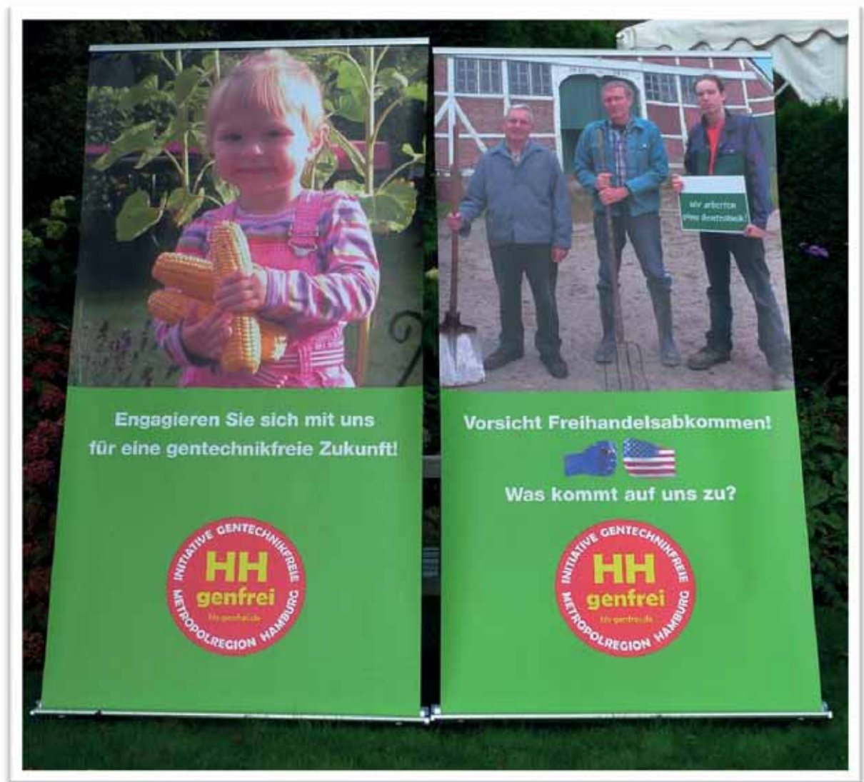
Initiative gentechnikfreie Metropolregion Hamburg