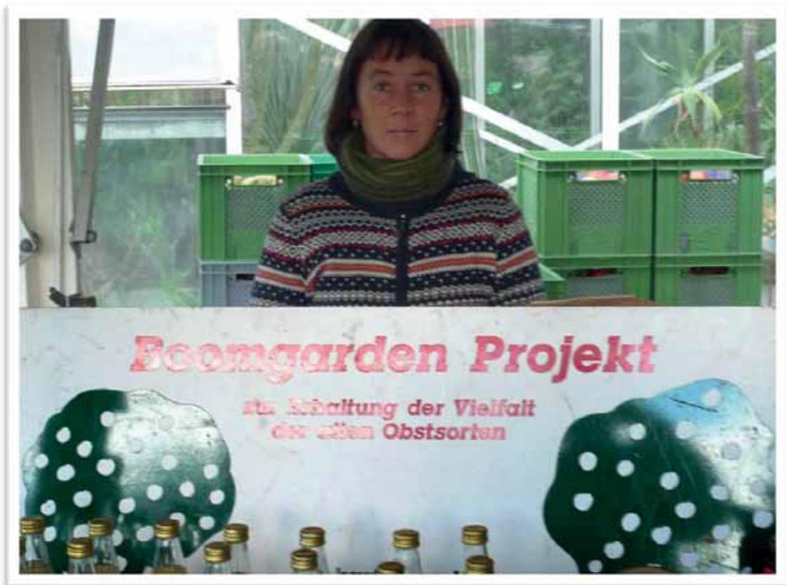
Boomgarden-Projekt und -Park Bücher- und Werkzeutisch (unten)