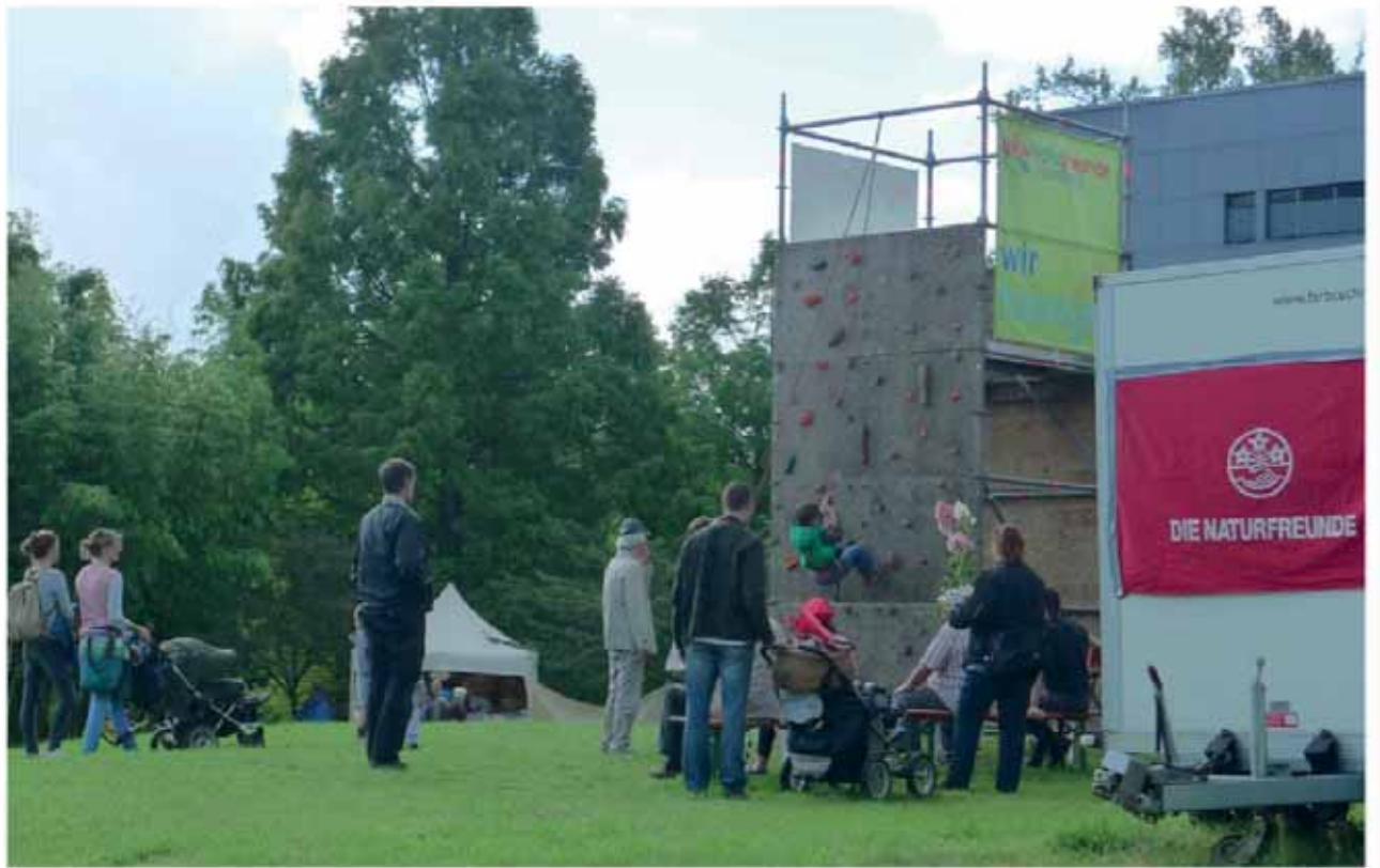
Klettern mit den NaturFreunden Hamburg Kupfertreiben