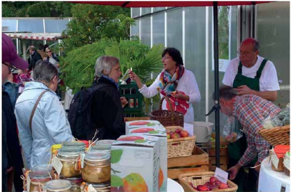
Reuer's Apfelhof De Immen (unten)