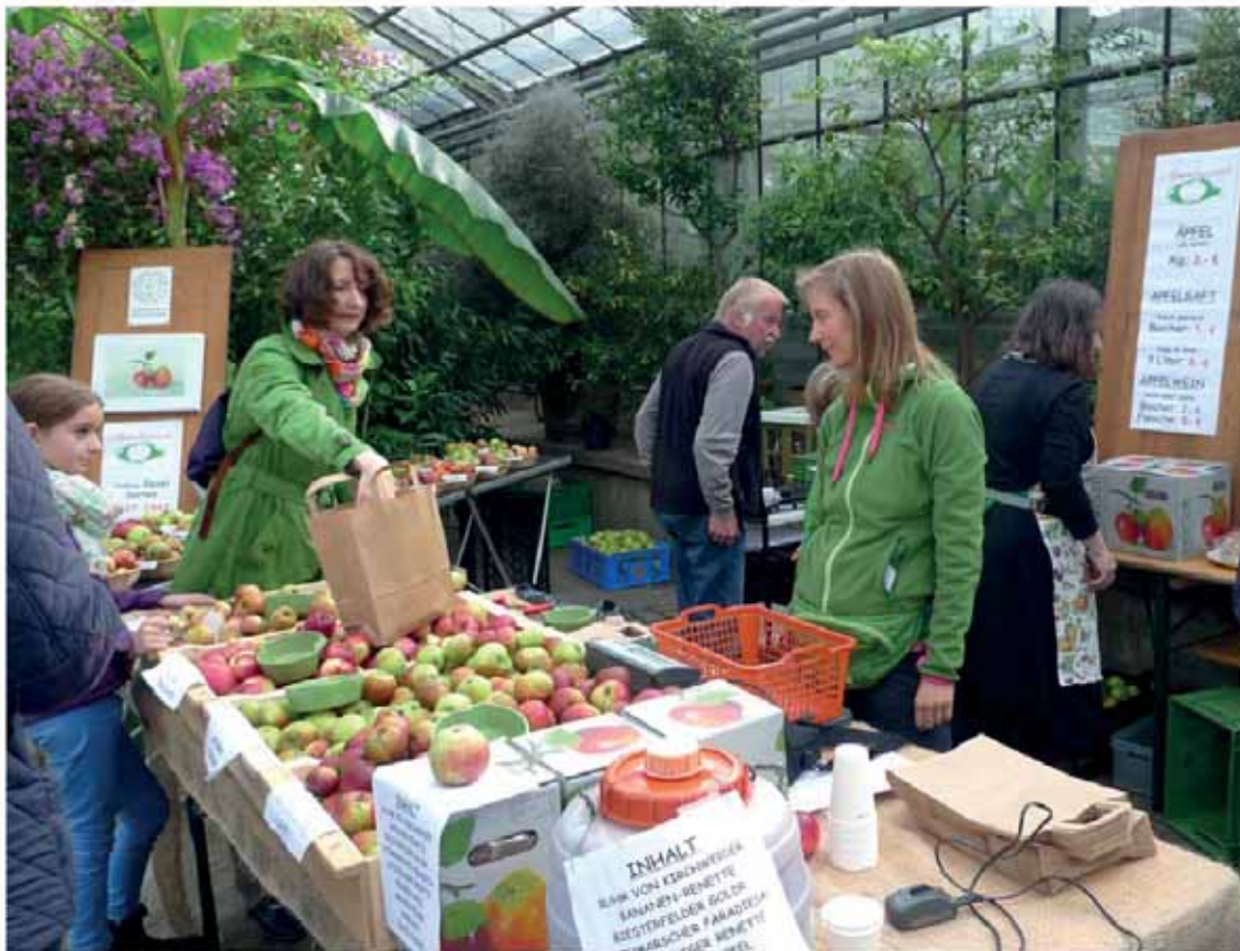
Appelwisch most of apples (unten)