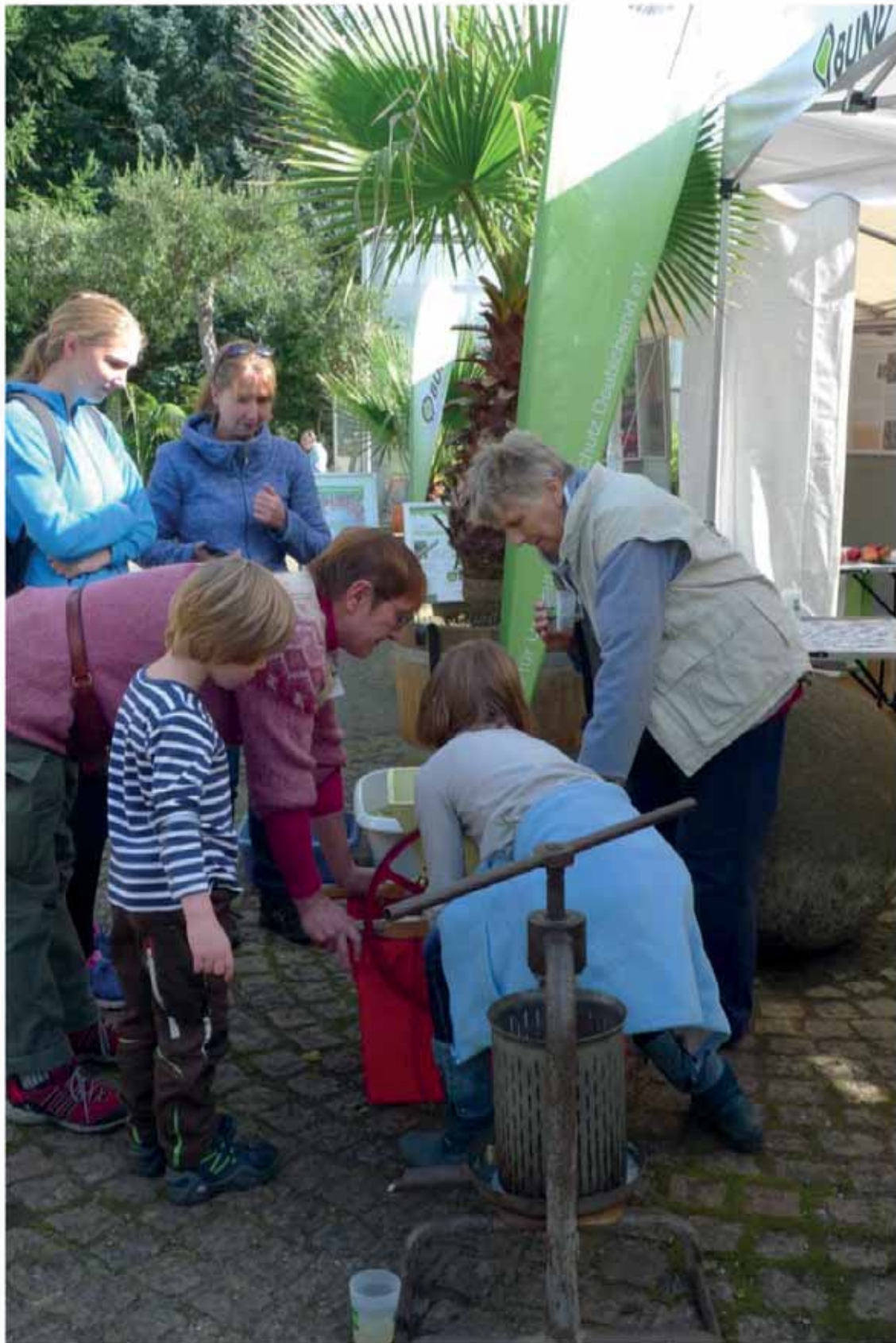
Saftpresen am Stand des BUND Hamburg